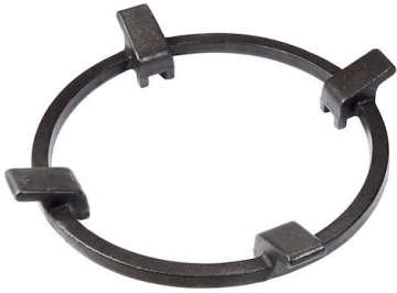
Porta Wok in Ghisa 9601 727