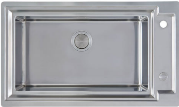
OUTLINE H25 6625 000